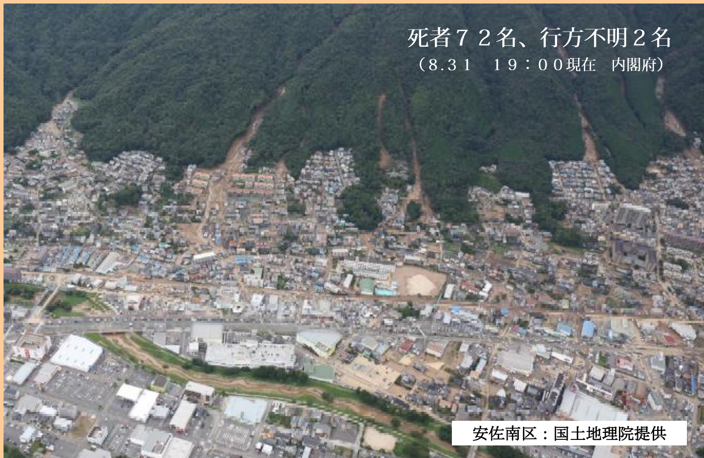
安佐南区