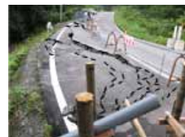
志津温泉北側に発生した地すべり(H17)