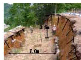
田麦俣地区地すべり頭部の陥没状況(H16)