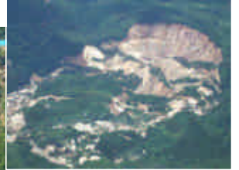
荒砥沢ダム上流で発生した地すべり(宮城県栗原市)