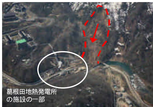
葛根田地熱発電所の施設の一部