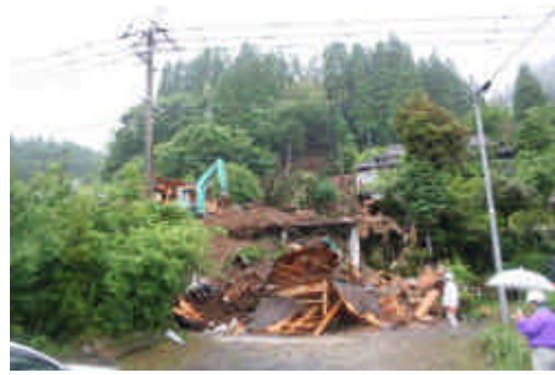
がけ崩れにより倒壊した民家(大分県九重町、死者1名)