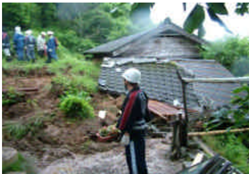
がけ崩れにより民家に土砂が流入 (熊本県多良木町、死者1名)

7月4日現在で 319件の土砂災害が発生。 死者 行方不明者は 既に20名に達した。