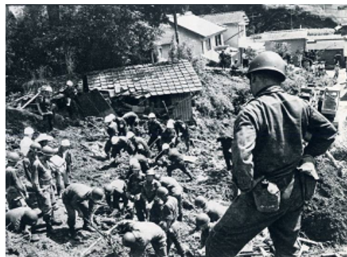
写真 高知県伊野町 枝川(いの町)、昭和5年9月 台風17号災害