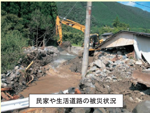
民家や生活道路の被災状況