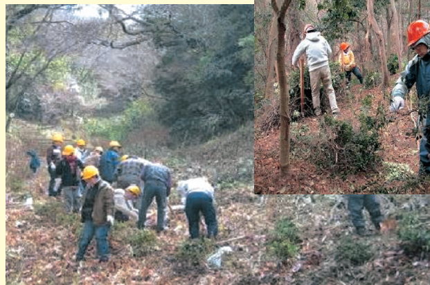
流域の荒廃による土砂災害と里山砂防対策