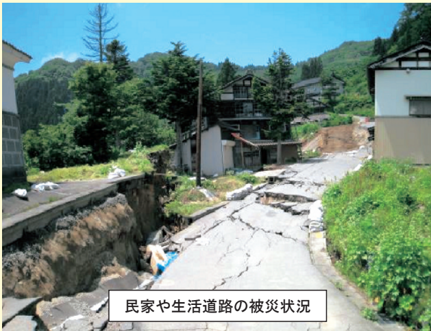
民家や生活道路の被災状況