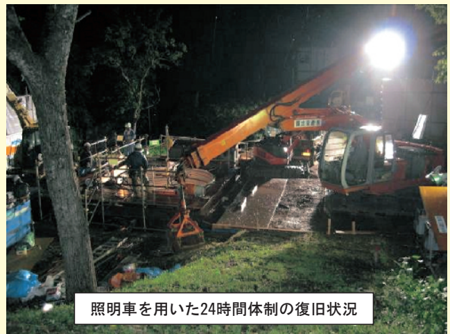
照明車を用いた24時間体制の復旧状況