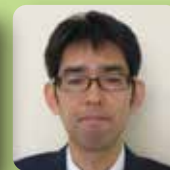
越智 英人 国土交通省北陸地方整備局 湯沢砂防事務所長