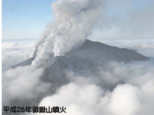
平成26年御嶽山噴火