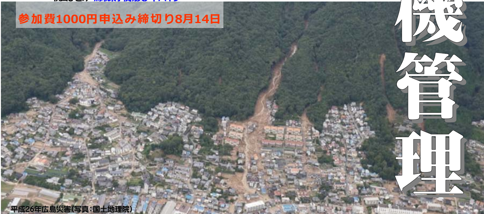
平成26年広島災害