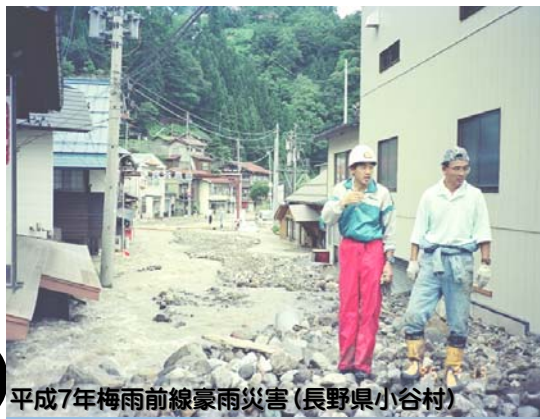
平成7年梅雨前線豪雨災害(長野県小谷村)